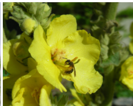
Wildbiene in Königskerze