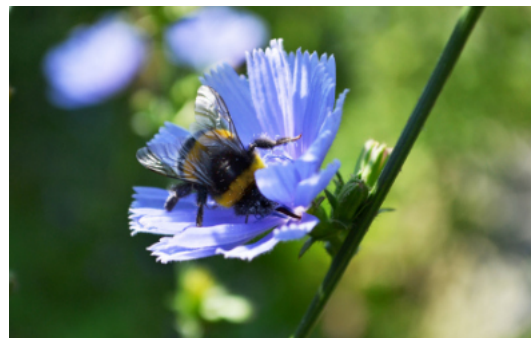
Erdhummel auf Wegwarte