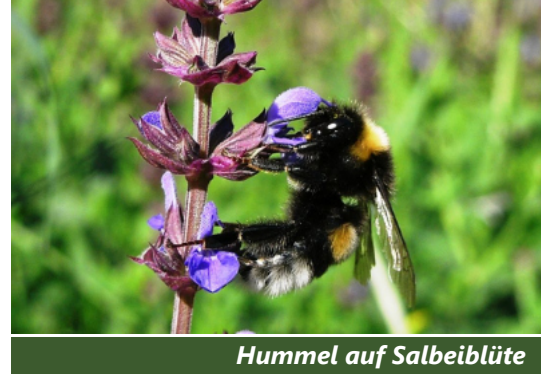
Hummel auf Salveiblüte

In Österreich gibt es 690 Wildbienenarten, darunter 47 Hummelarten. Die beste Bestäubungsrate erreichen eine Vielzahl verschiedener Wildbienenarten in Kombination mit Honigbienen. Etliche Wildbienenarten, besonders Hummeln, fliegen im Gegensatz zur Honigbiene auch bei Schlechtwetter.