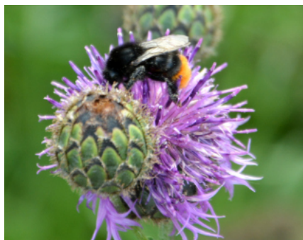
Steinhummel auf Flockenblume

Kriech-Günsel ( Ajuga reptans ) Wiesen-Kerbel ( Anthriscus sylvestris ) Schlag-Weidenröschen ( Epilobium angustifolium ) Wald-Erdbeere ( Fragaria vesca ) Wiesen-Storchschnabel ( Geranium pratense ) Echtes Johanniskraut ( Hypericum perforatum ) Gilbweiderich ( Lysimachia vulgaris ) Himmelschlüssel ( Primula elatior ) Gelbe Resede ( Reseda lutea ) Seifenkraut ( Saponaria officinalis ) Rote Lichtnelke ( Silene dioica ) Echte Goldrute ( Solidago virgaurea ) Rainfarn ( Tanacetum vulgare ) Wiesen-Bocksbart ( Tragopogon pratensis )