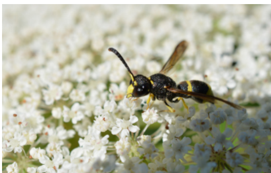
Wespe auf Holunder