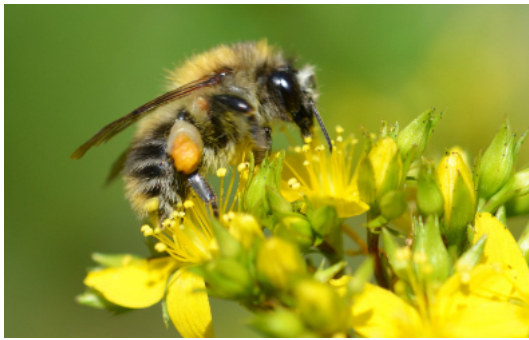
Pelzbiene auf Johanniskraut

Die Beziehung zwischen Blüten und Bestäubern ist komplex: manche Bienen haben ein breites Nahrungsspektrum, andere wieder sind spezialisiert auf eine oder wenige Pflanzenarten.