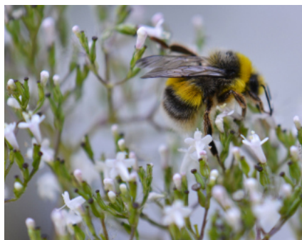
Erdhummel auf Baldrian